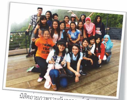
นิสิตถ่ายภาพร่วมกับอาจารย์เป็นที่ระลึก บริเวณจุดชมทิวทัศน์ จากจุดนี้หากมองลงไปด้านล่างก็จะเห็นต้นไม้เขียวขจีปกคลุมไปทั่วยอดเขา