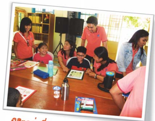
นิสิตกลุ่มที่ ๑ จัดกิจกรรมการสอนภาษาไทยกับนักเรียนที่อยู่ในระดับเด็กเล็ก ซึ่งเริ่มเรียนภาษาไทยเป็นครั้งแรก