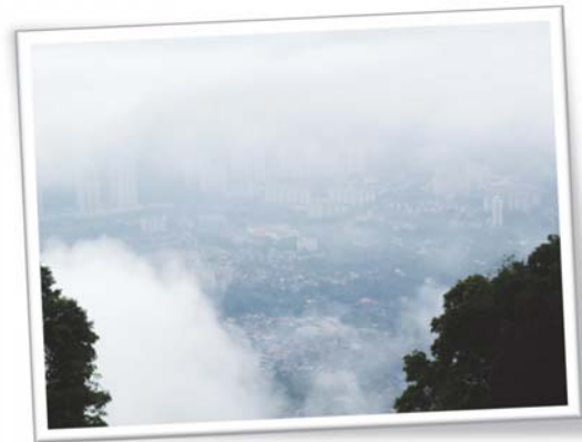
ทะเลหมอกยามเช้าที่ราบยอดเขา Penang Hill เมื่อมองจากจุดชมวิวทำให้เห็นเมืองจอร์จทาวน์เมืองมรดกโลกเป็นเสมือนเมืองในหมอก

ในยามค่ำของวันที่สองนี้เป็นกิจกรรมเชื่อมความสัมพันธ์ของผู้เข้าร่วมโครงการ โดยการซื้อวัตถุดิบจากตลาดนัดมาปรุงสุกกินรับประทานร่วมกัน จากนั้นเป็นกิจกรรมสนทนาการซึ่งเป็นการแสดงที่น่าตื่นตาตื่นใจและน่าประทับใจจากนิสิตสาขาวิชาภาษาไทย