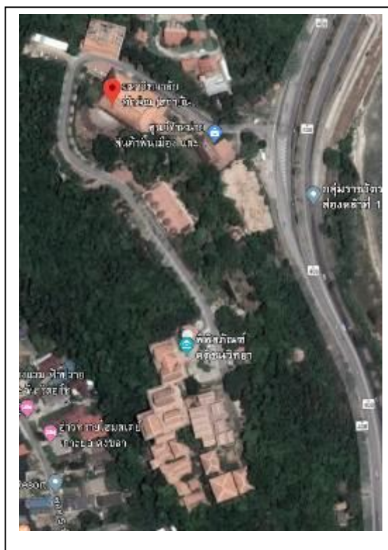
อำเภอเมืองสงขลา จังหวัดสงขลา