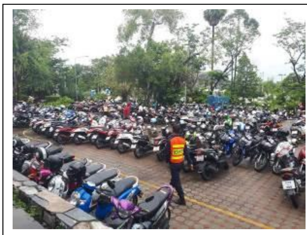
ภาพที่ 24 ที่จอดรถจักรยานยนต์