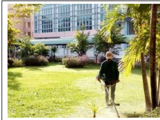
ภาพที่ 3 พื้นที่เปิดโล่ง บ้านอ่าวทราย ตำบลเกาะยอ อำเภอเมืองสงขลา จังหวัดสงขลา