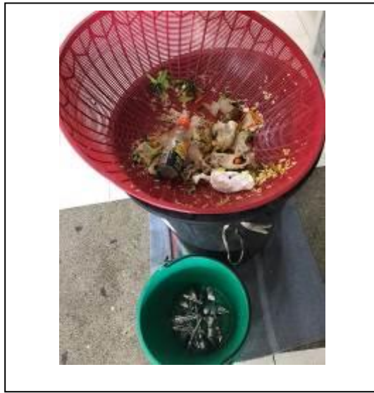
ภาพที่ 20 การคัดแยกเศษอาหาร

ลักษณะนิสัยการคัดแยกเศษอาหารให้กับนิสิตและบุคลากรที่ใช้บริการจากโรงอาหาร 1 และ 2 จำนวน 1500 คนต่อวัน ดังภาพที่ 20