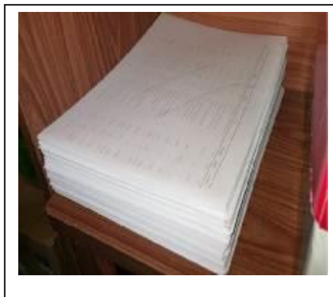
ภาพที่ 19 นำกระดาษหน้าเดียวมาใช้

1) มีการสนับสนุนให้นำกระดาษหน้าเดียวมาใช้ในสำนักงาน ดังภาพที่ 19