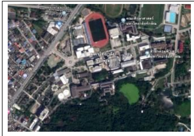
ภาพที่ 1 ตำบลเขารูปช้าง เนื้อที่ 142 ไร่

มหาวิทยาลัยทักษิณ วิทยาเขตสงขลา มีพื้นที่ จำนวน 2 พื้นที่ คือ 1) ตำบลเขารูปช้าง อำเภอเมืองสงขลา จังหวัดสงขลา เนื้อที่ 142 ไร่ 2) บ้านอ่าวทราย ตำบลเกาะยอ อำเภอเมืองสงขลา จังหวัดสงขลา เนื้อที่ 24 ไร่ รวมพื้นที่ทั้งหมด 4,867,200 ตารางเมตร มีพื้นที่เปิดโล่งทั้งหมด 267,899 ตารางเมตร มีสัดส่วนระหว่างพื้นที่โล่งต่อพื้นที่ทั้งหมด 5.50% มีสัดส่วนของพื้นที่โล่งต่อจำนวนประชากรของวิทยาเขตสงขลา 22.56 ตร.ม./คน (นิสิตจำนวน 11,237 คน บุคลากรจำนวน 634 คน รวมจำนวน 11,871 คน) ดังภาพถ่ายที่ 1-5