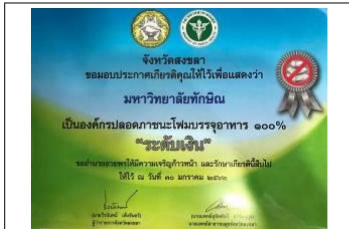
ภาพที่ 18 ไม่ใช้โฟมในการบรรจุอาหาร

4) 100 % ของร้านค้าในโรงอาหารในมหาวิทยาลัยทักษิณ วิทยาเขตสงขลา ไม่ใช้โฟมในการบรรจุอาหาร ดังภาพที่ 18