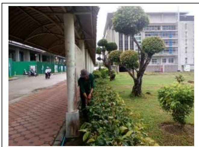
ภาพที่ 25 หลังคาทางเท้าในวิทยาเขตสงขลา

5.8 นโยบายเกี่ยวกับรถจักรยานและการเดินเท้าภายในวิทยาเขต อยู่ในระหว่างการสำรวจเกี่ยวกับรถจักรยาน อย่างไรก็ตามมหาวิทยาลัยทักษิณ วิทยาเขตสงขลาได้จัดสร้างทางเดินเท้าเชื่อมระหว่างอาคารอย่างเพียงพอ ดังภาพที่ 25