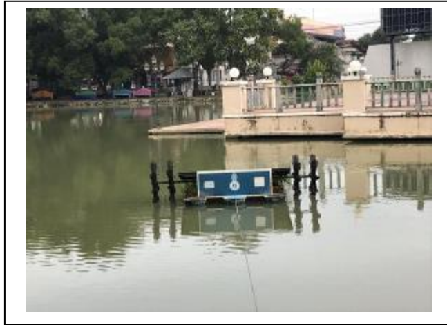
ภาพที่ 15 กังหันน้ำพลังงานแสงอาทิตย์

2.3) พลังงานทดแทนซึ่งผลิตได้ในวิทยาเขต พบว่า มีกังหันน้ำพลังงานแสงอาทิตย์จำนวน 1 เครื่อง เครื่องปั่นไฟในการต้มน้ำเพื่อบำบัดน้ำเสีย ดังภาพที่ 15