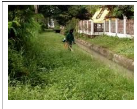
ภาพที่ 9 พื้นที่ที่ใช้ปลูกต้นไม้