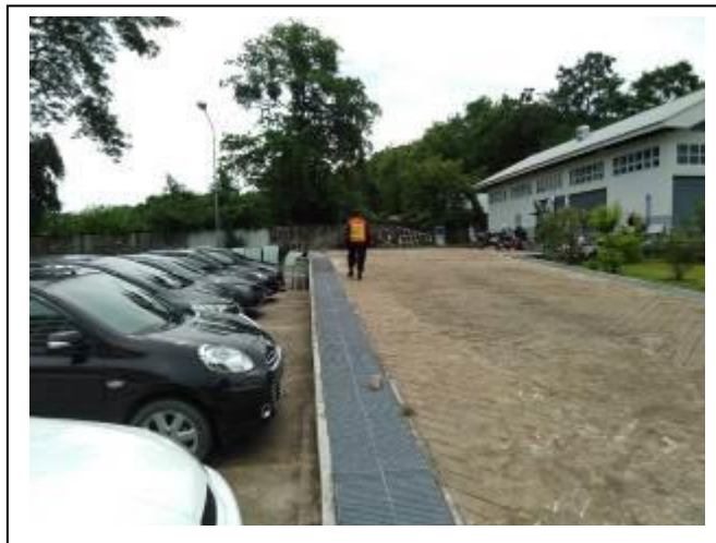
ภาพที่ 23 ที่จอดรถยนต์

5.4 ประเภทของที่จอดรถ พบว่า มีการจัดพื้นที่สำหรับจอดรถยนต์ และจอดรถจักรยานยนต์ อย่างเพียงพอแต่อย่างไรก็ตามมีแนวโน้มการจัดพื้นที่การจอดรถยนต์ และจอดรถจักรยานยนต์ลดลง ดังภาพที่ 23-24