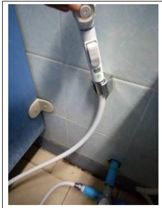
ภาพที่ 22 อุปกรณ์ประหยัดน้ำ

4.4 การใช้น้ำที่ทำการบำบัดแล้ว พบว่า มีการใช้น้ำจากสระริมบึงซึ่งเป็นบ่อบำบัดน้ำเสียมาใช้ในการรดน้ำต้นไม้