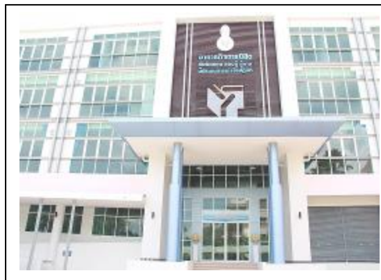
ภาพที่ 13 อาคารอัจฉริยะ (อาคารกิจการนิสิต)

2.2) โครงการอาคารอัจฉริยะ พบว่า ร้อยละ 6.06 ของอาคารในมหาวิทยาลัยทักษิณ วิทยาเขตสงขลา (33 อาคาร) กำหนดให้เป็นอาคารอัจฉริยะ นั่นคือ อาคารกิจการนิสิตและอาคาร 7 ซึ่งเป็นอาคารที่ออกแบบให้มีแสงสว่างจากภายนอกส่องทั่วถึงอย่างเพียงพอลดการเปิดการทำงานของหลอดไฟ และมีมาตรฐานชาติผ่านอย่างเพียงพอ ดังภาพที่ 13-14