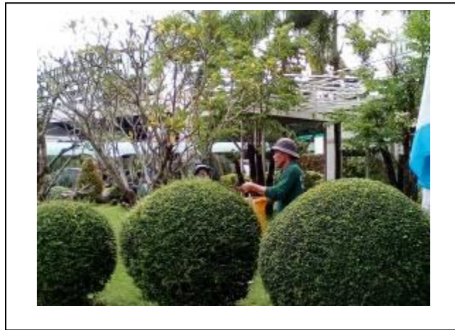
ภาพที่ 9 พื้นที่ที่ใช้ปลูกต้นไม้