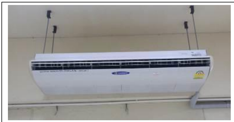
ภาพที่ 11 เปลี่ยนเครื่องปรับอากาศและเน้นการใช้อุปกรณ์ไฟฟ้าฉลากเบอร์ 5

2.1) การใช้อุปกรณ์ประหยัดพลังงาน พบว่า ปี 2559 มีการเปลี่ยนอุปกรณ์ประหยัดพลังงานและใช้งานจนถึงปี 2561 คือ เปลี่ยนหลอดไฟฟ้า LED 6,000 หลอด เปลี่ยนเครื่องปรับอากาศ 40 เครื่อง และเน้นการใช้อุปกรณ์ไฟฟ้าฉลากเบอร์ 5 รายละเอียดดังภาพที่ 11-14