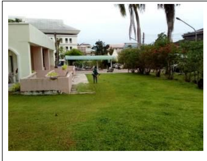
ภาพที่ 5 พื้นที่เปิดโล่ง บ้านอ่าวทราย ตำบลเกาะยอ อำเภอเมืองสงขลา จังหวัดสงขลา

อย่างไรก็ตามมหาวิทยาลัยทักษิณ วิทยาเขตสงขลา ได้พัฒนาให้มีพื้นที่ที่เป็นมิตรกับสิ่งแวดล้อม จำนวน 3 พื้นที่ คือ 1) พื้นที่ที่มีลักษณะเป็นป่า 2) พื้นที่ใช้ปลูกต้นไม้ และ 3) พื้นที่ดูดซับน้ำ โดยขนาดของพื้นที่อยู่ในระหว่างการสำรวจ รายละเอียดดังภาพที่ 6-10 มีงบประมาณสนับสนุนเพื่อความยั่งยืนจำนวนอยู่ในระหว่างการรวบรวมข้อมูล